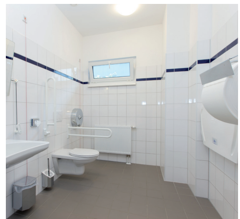
Barrierefreies WC EG