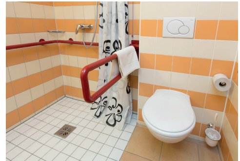
WC in Bad