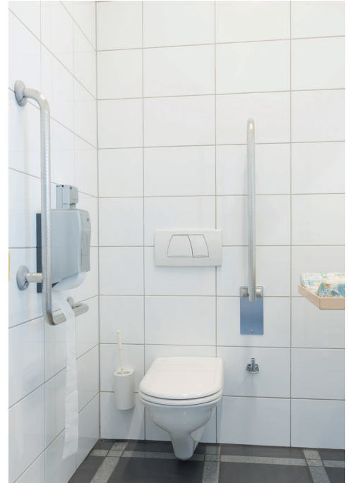
Barrierefreies WC Erdgeschoss