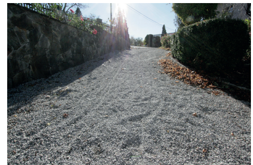
Zugang WC und Gastgarten

Die Toiletten befinden sich im Untergeschoß ohne Lift. Sie sind über den Gastgarten erreichbar. Dazu muss man außerhalb des Gebäudes den Abgang zum Gastgarten nehmen, dieser weist ein Gefälle auf und ist stark geschottert!