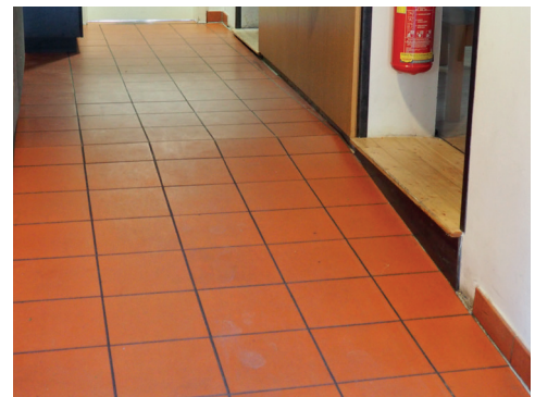
Zugang zu Toilette